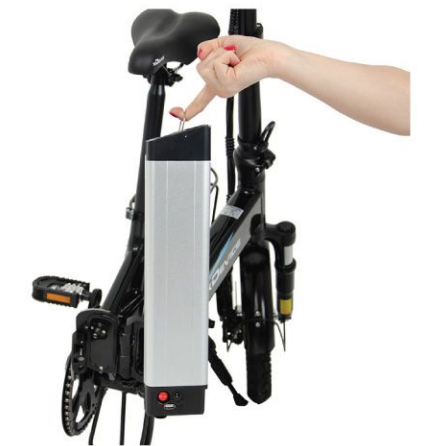
应用场景 Application scenario