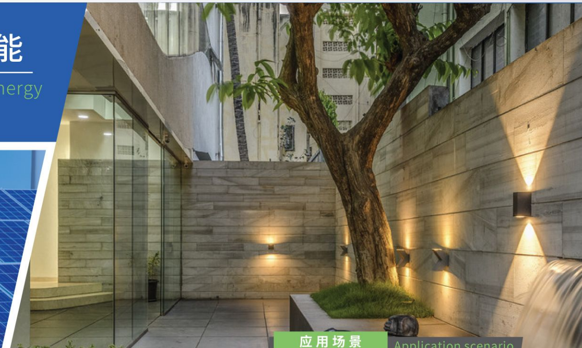
应用场景 Application scenario